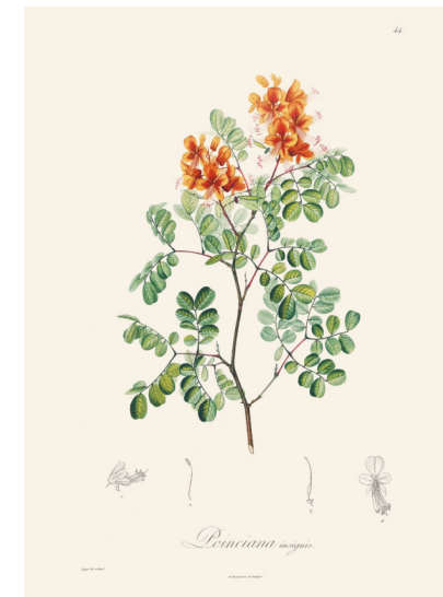
Alexander von Humboldt: Botanische Zeichnungen

Die Clubabende finden normalerweise regelmäßig am ersten Dienstag jeden Monats statt. Frühzeitig geben wir bekannt, ob und in welcher Form eine Veranstaltung in diesem Rahmen durchgeführt werden kann.